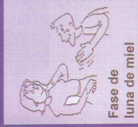
Fase de luna de miel