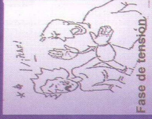
Fase de tensión