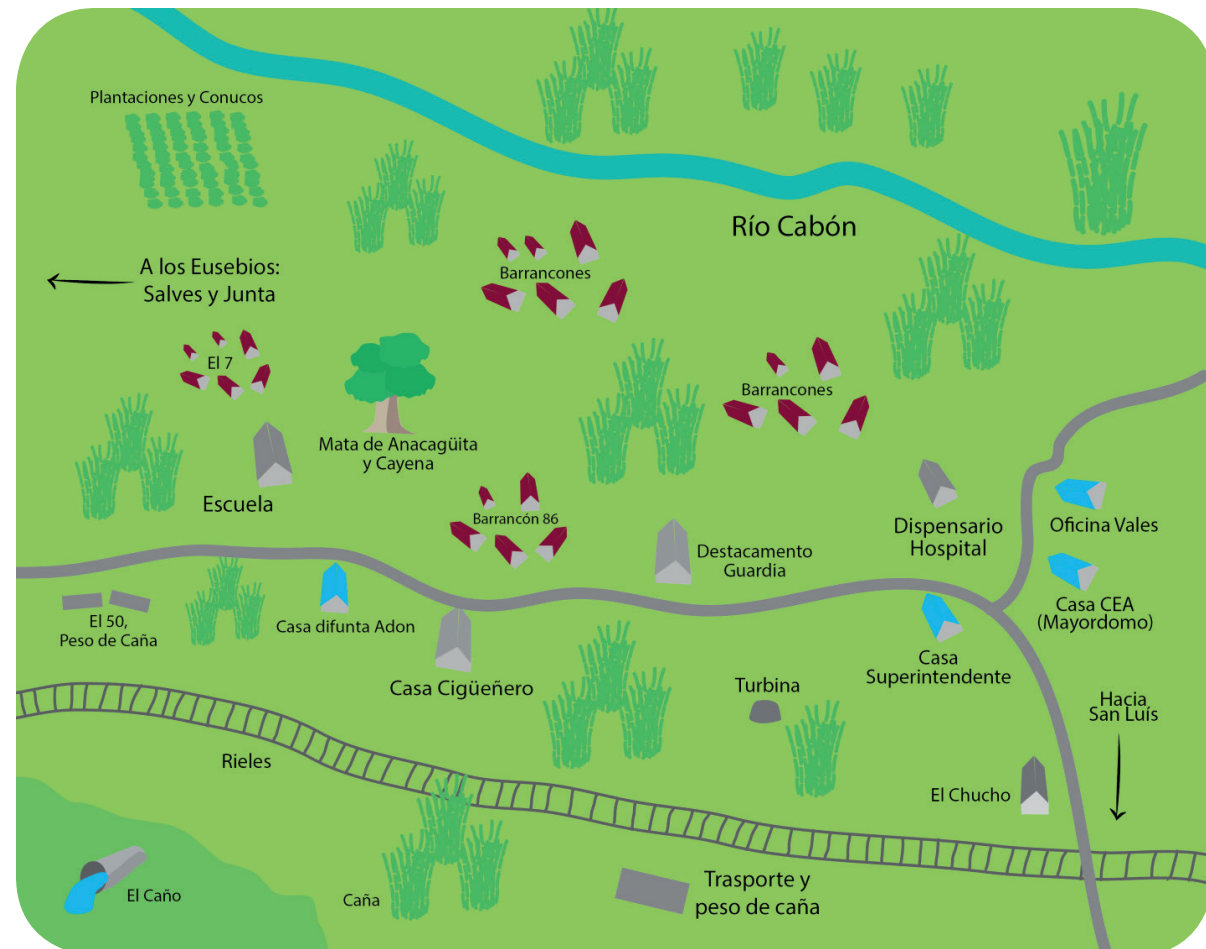
Mapa de memoria territorial del Batey de Mata Mamón

“Se bailaba Picó, guitarra, vellonera, bassie, habanero, entre otros, se hacían reuniones, se iban “poniendo los cheles” en la Vellonera y se bailaba mucho el habanero, la bachata, y en las velloneras venían mujeres de otros pueblos, pero era distinto que ahora, porque los muchachos