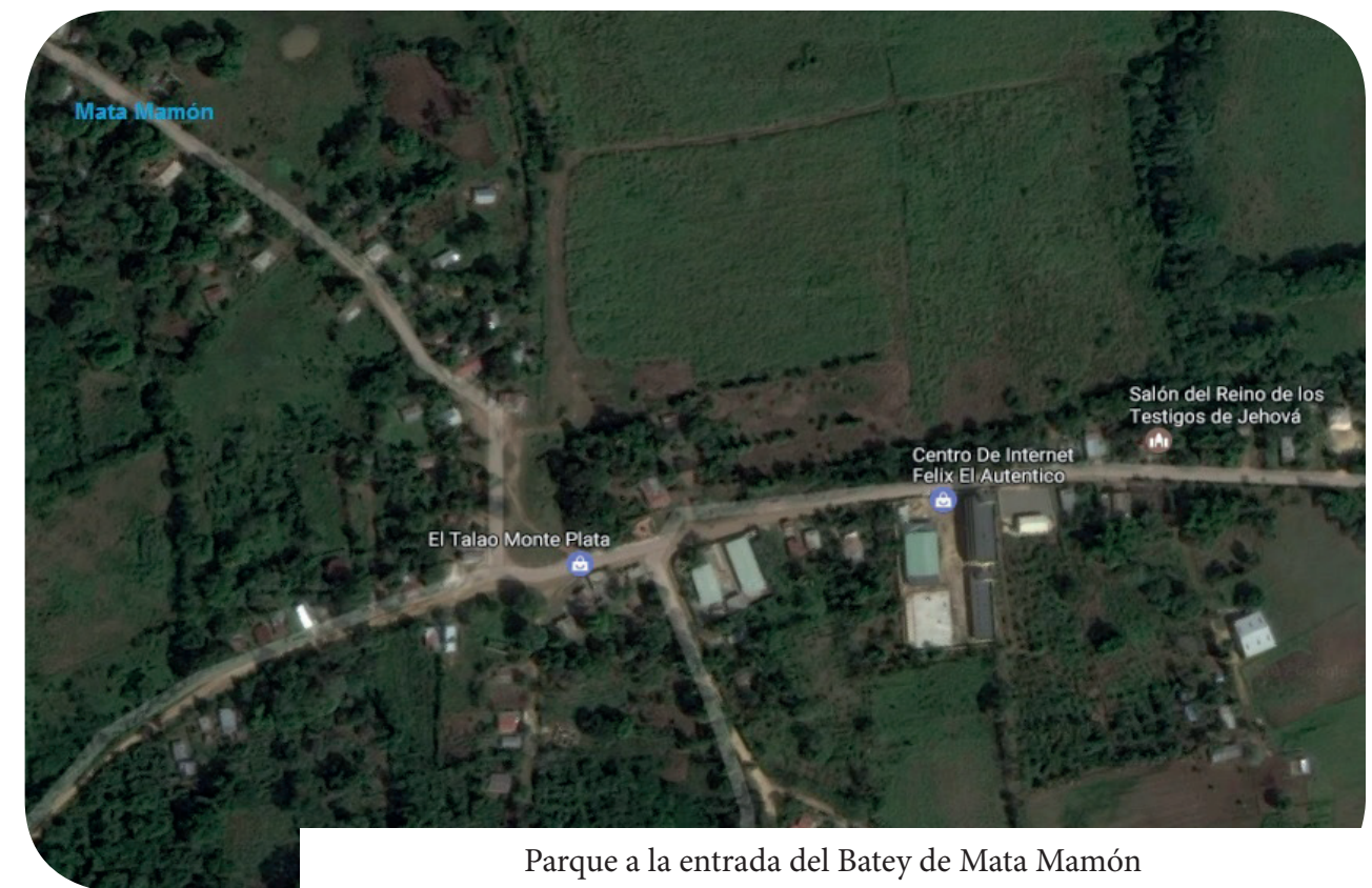
Parque a la entrada del Batey de Mata Mamón

En este mapa vemos la localidad de Mata Mamón en la actualidad, a pesar de que mantiene muchas tierras con vegetación, sabemos que éstas no representan una fuente de trabajo para la