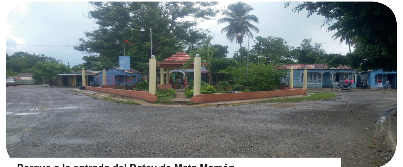
Parque a la entrada del Batey de Mata Mamón

Aunque el Batey es un territorio que los mayores perciben como transformado y deteriorado en comparación a los tiempos de antes, los habitantes del batey, también valoran algunos aspectos como ha sido la cooperación y apoyo recibido por MUDHA, en talleres, valorización del Gagá como patrimonio cultural del batey, y la ayuda con el proceso de documentación de los Bateyanos de origen haitiano. Los jóvenes, valoran el sacrificio que saben que sus antepasados hacían trabajando en los cañaverales, y les preocupa el no tener muchas fuentes de motivación y trabajo en la actualidad.